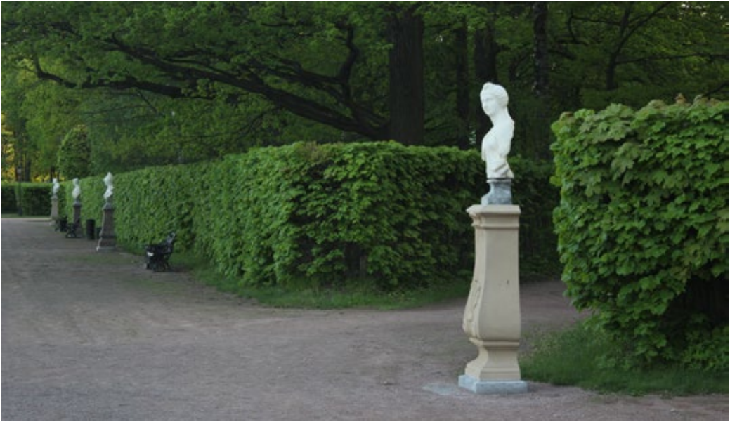
Илл. 137. Парковая скульптура, партер (копии). 2019 г. Искусственный мрамор. Музей-усадьба «Кусково», Москва, Россия.