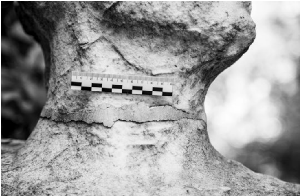
Рис. 3. Бюст «Оттон» (Ск-112), фрагмент. XVIII в. Мрамор белый. Музей-усадьба «Кусково», Москва, Россия.

В 1998 г. сотрудниками ВХНРЦ им. И. Э. Грабаря была произведена очистка, удаление стойких клеевых и цементных масс, мастиковка швов и сколов, восполнение, склейка, многократная пропитка 4 .