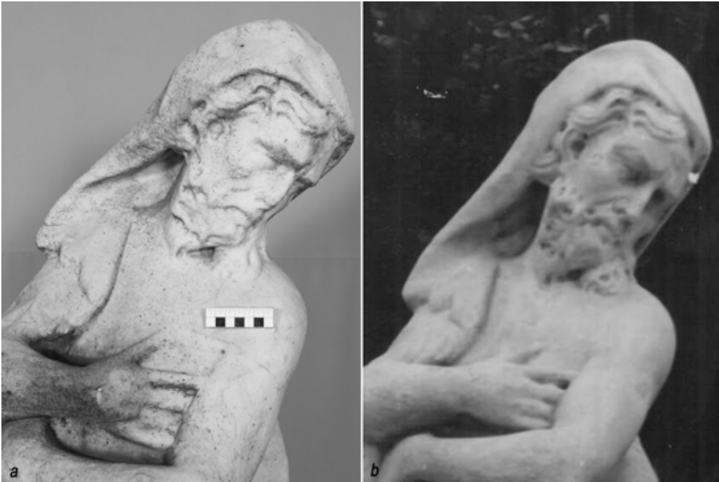
Рис. 1. Статуя «Геркулес» (Ск-65), фрагмент. XVIII в. Мрамор белый. Музей-усадьба «Кусково», Москва, Россия. а – До реставрации. Июль 2019 г. б – Архивная фотография, фототека музея-усадьбы «Кусково». 1979

Ориентируясь на сложившуюся в Петербурге систему ухода за памятниками, на зиму статуи и бюсты закрывали холщовыми мешками для защиты от дождя и снега. А в сохранившихся документах употребляются те же термины при описании сохранности, что и в Летнем саду: «скульптура повреждена», «голова отшиблена» [11; 15]. В этот период стремились исключительно к восстановлению декоративных качеств, согласно сформировавшимся к середине XVIII в. эстетическим представлениям.