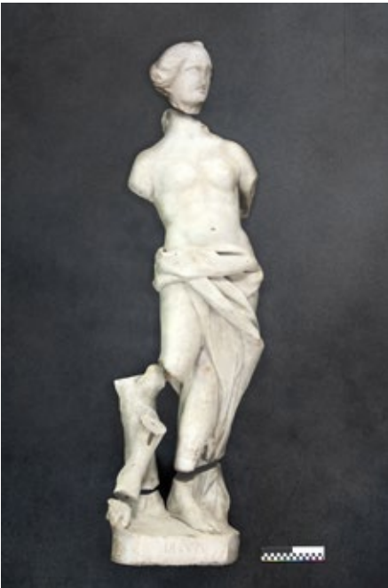
Илл. 138. Скульптура «Флора»/«Диана» до реставрации. XVIII в. Мрамор белый. Музей-усадьба «Кусково», Москва, Россия.