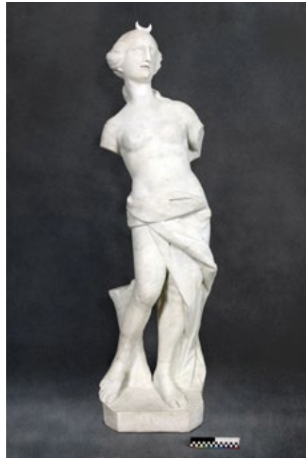
Илл. 139. Скульптура «Флора»/«Диана» после реставрации. XVIII в. Мрамор белый. Музей-усадьба «Кусково», Москва, Россия.