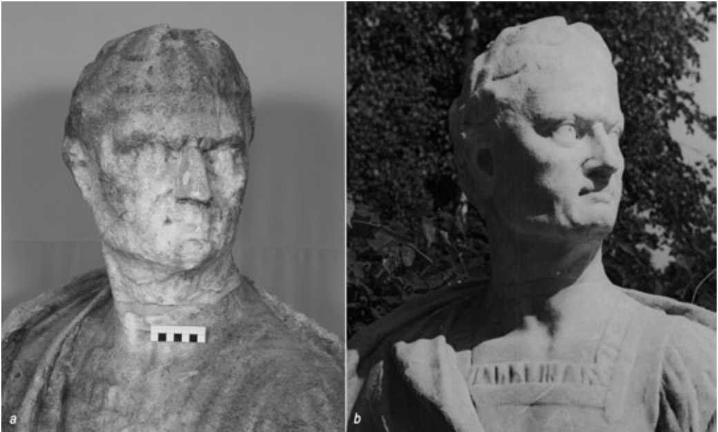
Рис. 2. Бюст «Оттон» (Ск-112), фрагмент. XVIII в. Мрамор белый. Музей-усадьба «Кусково», Москва, Россия. а – До реставрации. Июль 2019 г. б – Архивная фотография. 1979

левич, хорошо известная своим опытом работы со скульптурой Летнего сада. Составленный «Акт по определению необходимых реставрационных работ парковой скульптуры Музея „Усадьба Кусково в XVIII веке“» содержит перечисление скульптур, описание их состояния сохранности, включающее отметки о неудачных предшествующих ремонтах и перечень необходимых работ по реставрации. Согласно списку, в реставрации нуждалось 45 статуй и бюстов из парка и 6 статуй в нишах грота. В декабре 1940 г. был составлен технический отчёт, который включал работы по промывке, расчистке, склейке, укреплению и доделкам по аналогии. К работам должны были приступить летом 1941 г., однако начало Великой Отечественной войны потребовало укрытия скульптуры в подвалах дворца, и следующий этап реставрации связан уже с восстановлением парка после войны. Тогда проводились промывка и восстановление утрат.