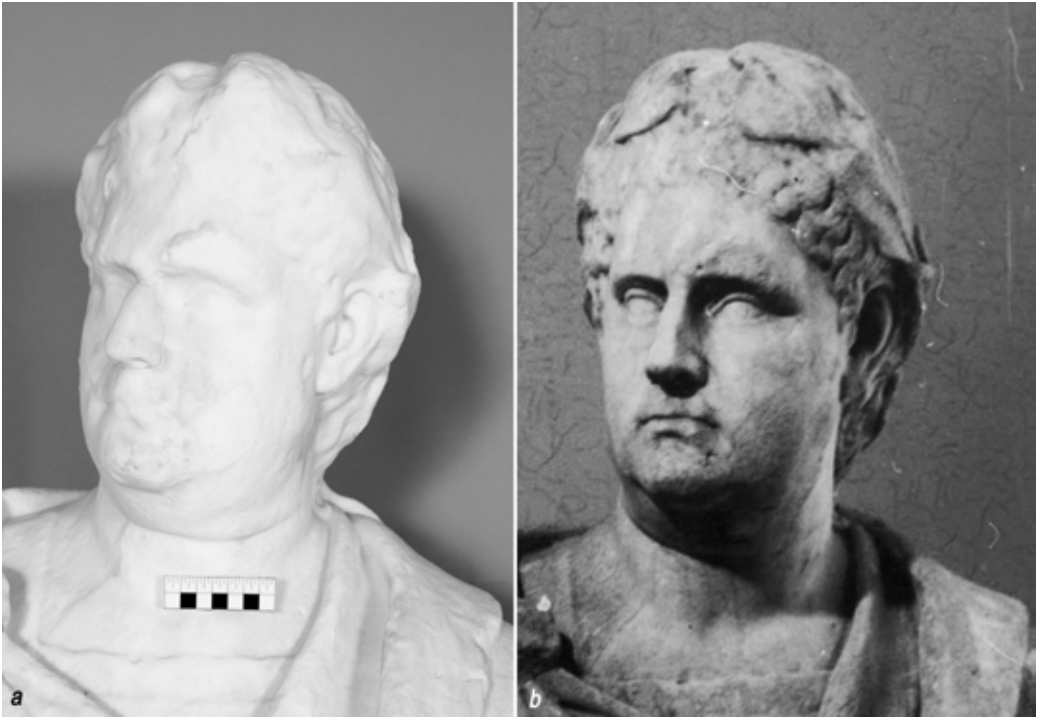
Рис. 4. Бюст «Вителлий» (Ск-53), фрагмент. XVIII в. Мрамор белый. Музей-усадьба «Кусково», Москва, Россия. а – В процессе реставрации, после промывки. Архив ООО «РМ «Наследие», 2019. б – Архивная фотография, фототека музея-усадьбы «Кусково». 1979

Наблюдалось локальное изменение цвета камня: зоны, потемневшие от въевшихся в структуру загрязнений. В связи со специфической особенностью данного мрамора (железистые включения в структуре камня) на поверхности наблюдались многочисленные пятна ржавчины, участки, окрашенные в светло-желтый, оранжевый и буро-коричневые цвета, образовавшиеся вследствие регулярного воздействия атмосферных осадков.