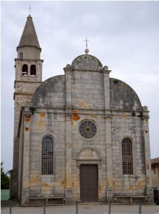
Рис. 1. Церковь Благовещения, Светвинченат, Истрийская жупания, Хорватия. Между 1492 и 1555 гг.

ни 5 , уже на момент его составления, т. е. в 1492 г. (за 11 лет до смерти), возведение церкви Благовещения было частью обширного градостроительного замысла. У стен феодального замка должна была разместиться просторная площадь, окружённая важными для обитателей вотчины сооружениями: приходской церковью, лоджией и домами для клира и путников. Таким образом, площадь должна была стать новым светским и религиозным центром поселения — центром, напрямую связанным с феодальным поместьем и возведённым по инициативе феодала.