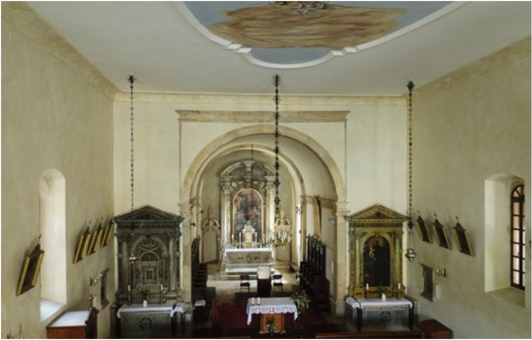
Рис. 2. Интерьер церкви Благовещения, Светвинченат, Истрийская жупания, Хорватия. Между 1492 и 1555 гг.

церкви и её объёмно-пространственной композиции склонялись к более ранней датировке концом XV – началом XVI вв. [25, p. 212; 17, str. 100–101].