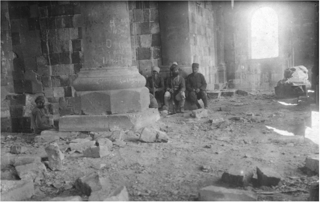
Рис. 11. Помещение I Отделения Анийского музея древностей. 20.X.1919 г. ФО НА ИИМК РАН. Отп. О.1739/38