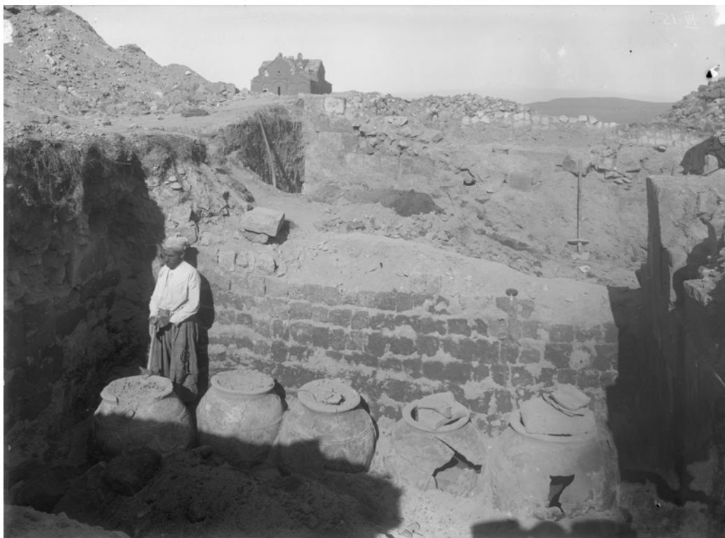
Рис. 3. Раскопки домов у Ашотовых стен в 1893 г. Нег. III 15