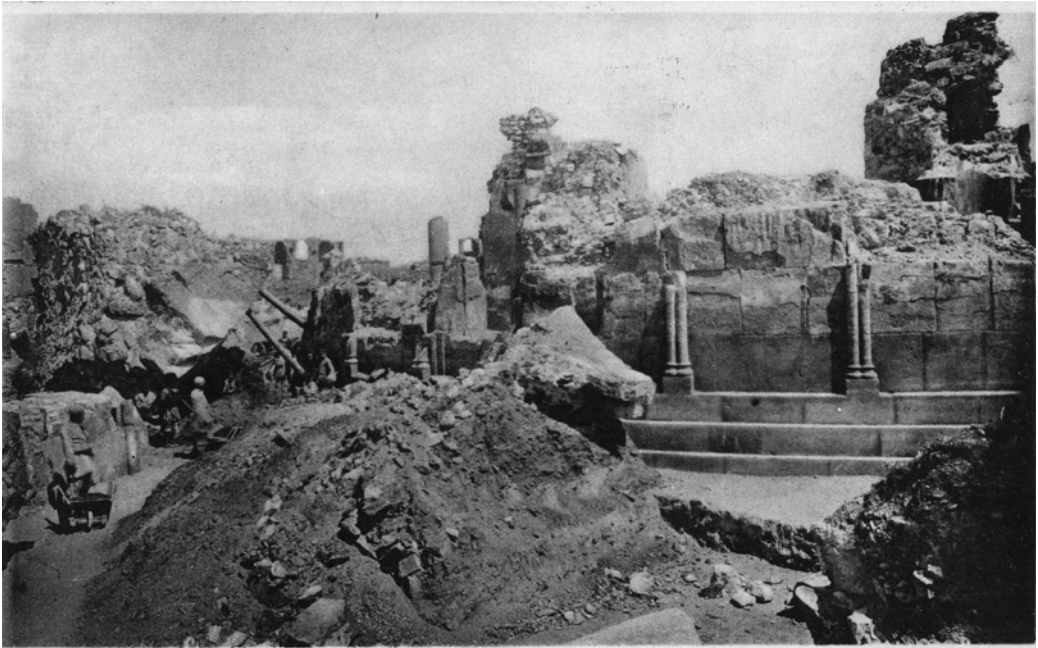
Ани. Круглая ц. св. Григорія, постройка царя Ташика I. Հիշ. Չափը 4 5 մետր շինած հար տղտղտղիկ. Նորը Գրիգոր: