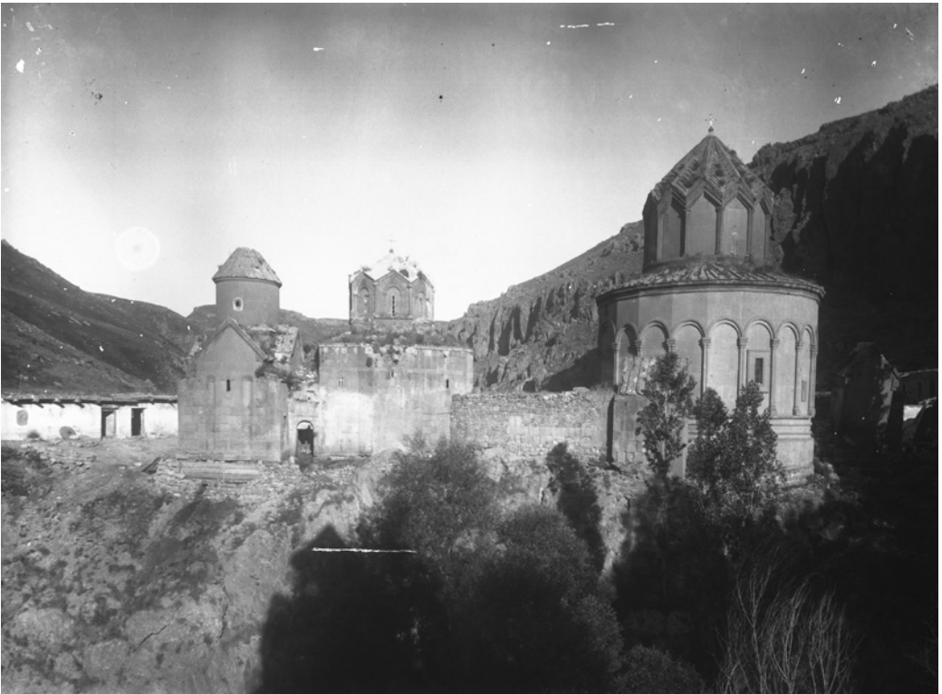
Рис. 5. Монастырь Хцконк в 1892 г. Нег. III 252