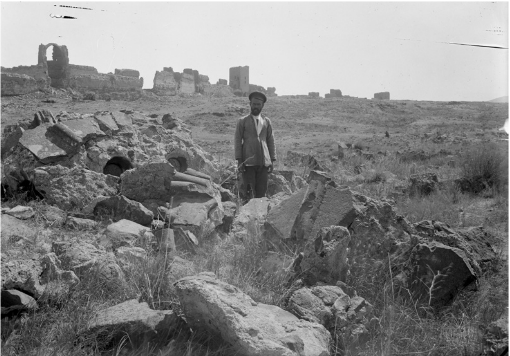
Рис. 12. Раскопки сооружения у Карских ворот, 1910 г. Нег. II 43027