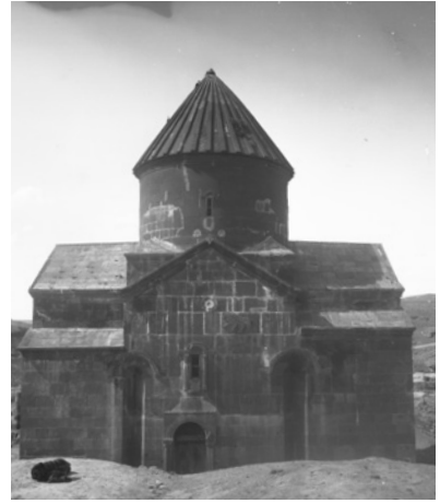
Рис. 6. Монастырь Кармирванк близ Ани в 1892 г. Нег. III 205