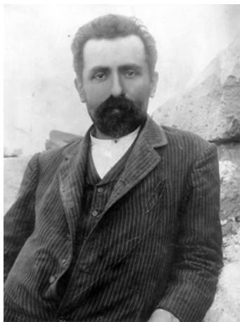
Рис. 1. Николай Яковлевич Марр в 1890-е гг. ФО НА ИИМК РАН. Отп. 0.1067/11