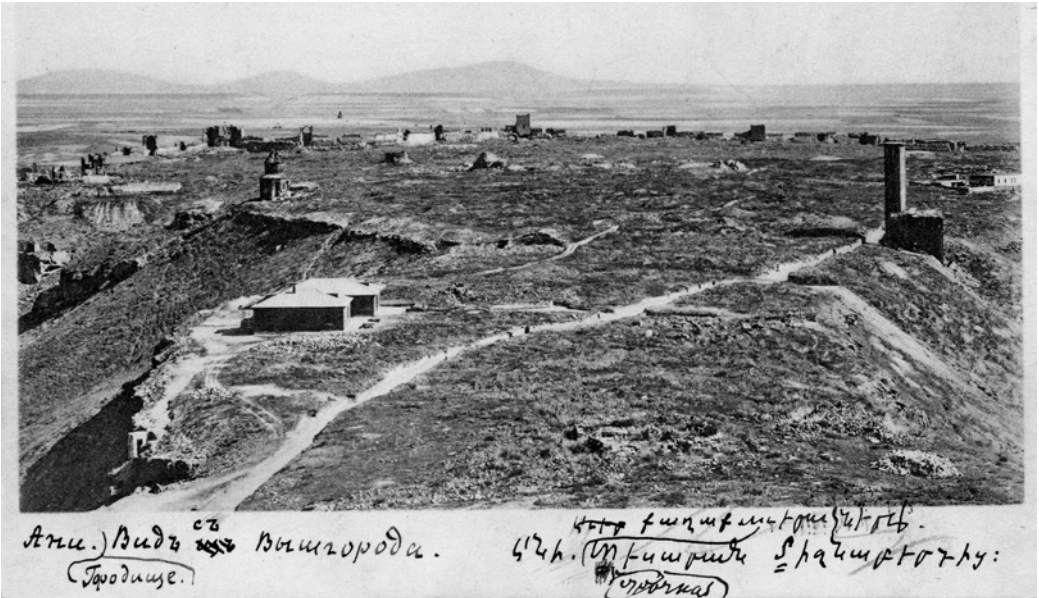
Рис. 8. Анийское городище. Вид с Вышгорода. ФО НА ИИМК РАН. Отп. O. 749/1

Ани. Вид с с Вышгорода. (Городище.) 426. Ступица в храме с арками