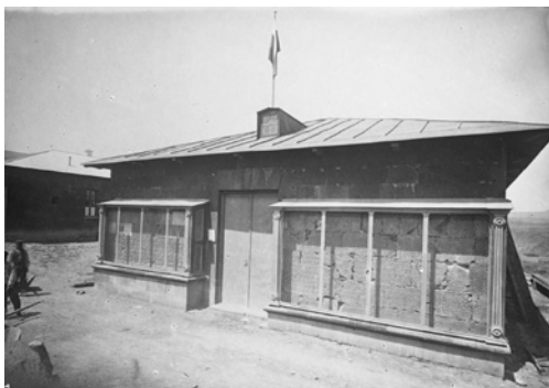
Рис. 13. II Отделение Анийского музея древностей. ФО НА ИИМК РАН. Нег. I 26194