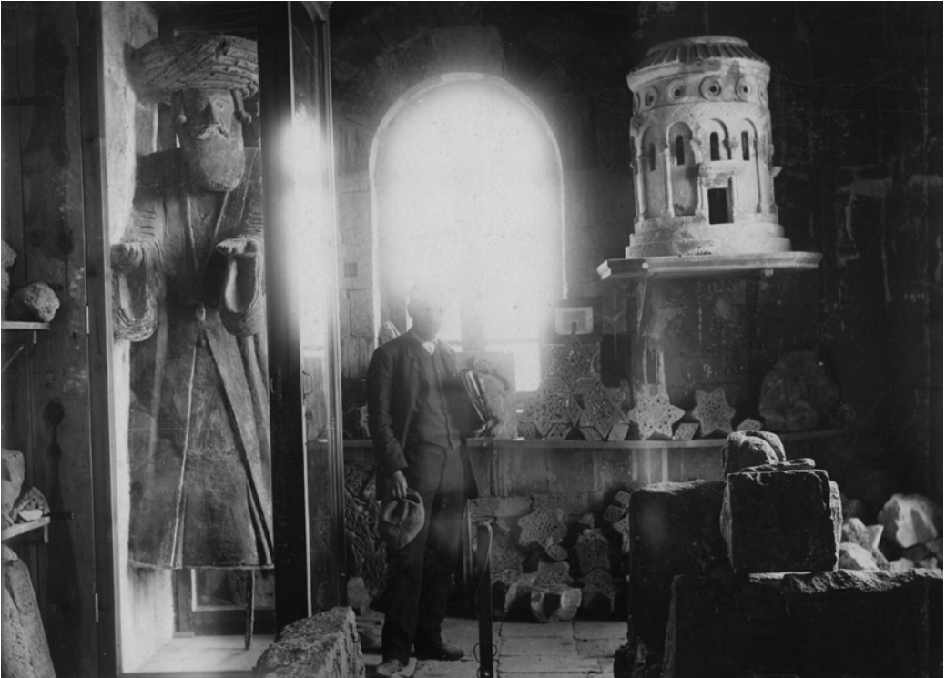
Рис. 7. I отделение Анийского музея древностей. Стоит Н. Я. Марр. Фото Лалайца, 1906 г. ФО НА ИИМК РАН. Отп. Q 473/17