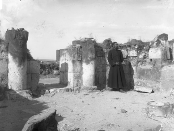
Рис. 4. Раскопки церкви Хамбушенц в 1893 г. Столбы у входа. Фото Н. Я. Марра. ФО НА ИИМК РАН. Нег. III 26