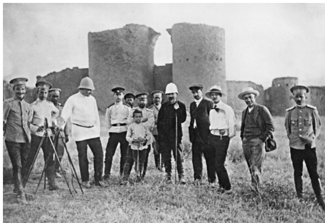
Рис. 2. Участники десятой анийской кампании у крепостных стен Ани, 1911 г. Справа пятый — Н.Я. Марр. ФО НА ИИМК РАН. Отп. 0.1067/24