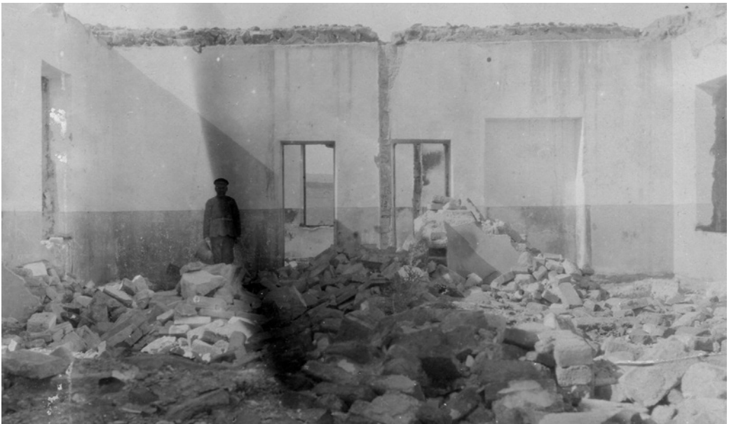
Рис. 10. Дом заведующего раскопками Анийской экспедиции. 20.X.1919 г. ФО НА ИИМК РАН. Отп. 0.1739/36