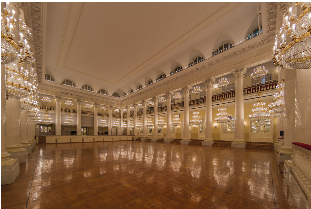
Илл. 36. Колонный зал Дворянского клуба (Дома Союзов). М. Ф. Казаков, 1784–1787 гг. 2018 г.