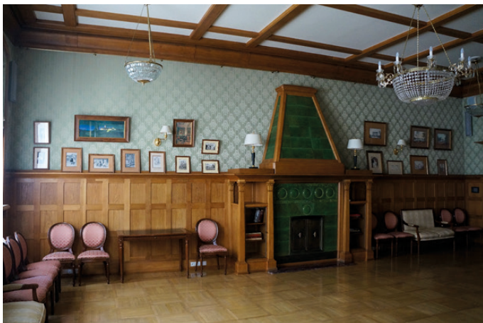
Илл. 43. Особняк В. С. Кочубея в Санкт-Петербурге. Столовая или Каминный зал.