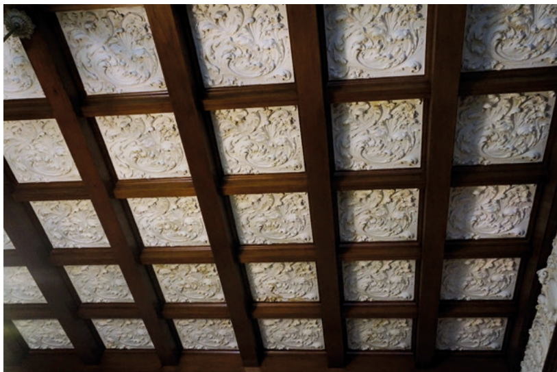
Илл. 47. Особняк Ф. Г. Бажанова в Санкт-Петербурге. Кессонированный потолок. Пластины ангипты в полях кессонов. Фотография В. С. Торбика, 2020