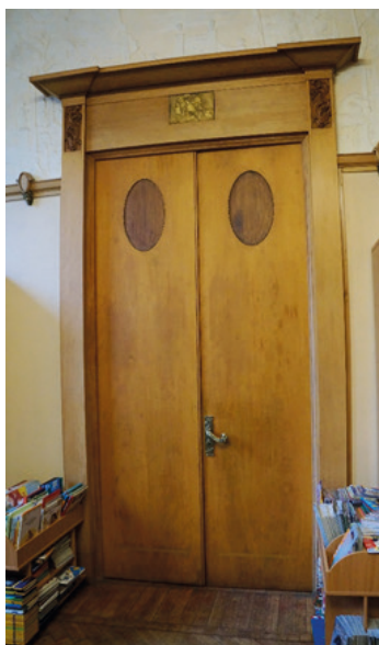
Илл. 48. Особняк Ф. Г. Бажанова в Санкт-Петербурге. Дверные полотна щитовой конструкции со стороны Грушевой гостиной. Фотография В. С. Торбика, 2020