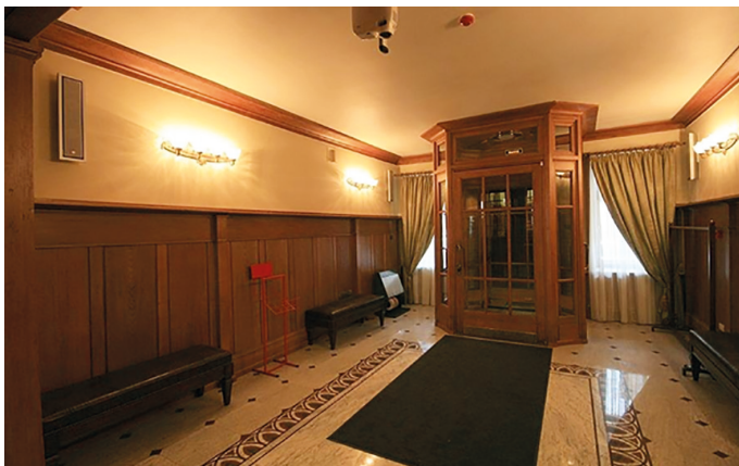
Илл. 41. Особняк В. С. Кочубея в Санкт-Петербурге. Холл. Фотография В. С. Торбика, 2020