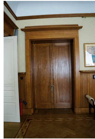
Илл. 46. Особняк В. С. Кочубея. Двухстороннее дверное полотно со стороны Кабинета князя. Фотография В. С. Торбика, 2020