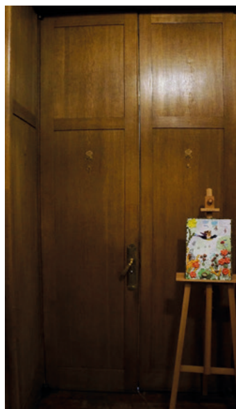
Илл. 49. Особняк Ф. Г. Бажанова в Санкт-Петербурге. Дверные полотна щитовой конструкции со стороны коридора. Фотография В. С. Торбика, 2020