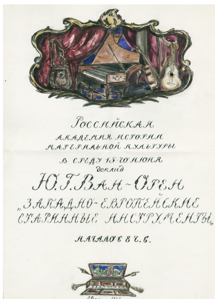
Илл. 58. Д. Д. Бушен. Афиша к докладу Ю. Г. Ван Орена «Западноевропейские старинные инструменты». 1921 г. РО НА ИИМК РАН. Ф. 2. Оп. 1. 1921. Д. 123. Л. 22. Публикуется впервые