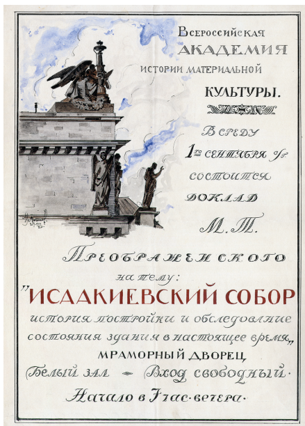
Илл. 56. В. В. Воинов. Афиша к докладу М. Т. Преображенского «Исаакиевский собор. История постройки и обследование состояния здания в настоящее время». 1920 г. РО НА ИИМК РАН. Ф. 2. Оп. 1. 1920. Д. 73. Л. 18. Публикуется впервые