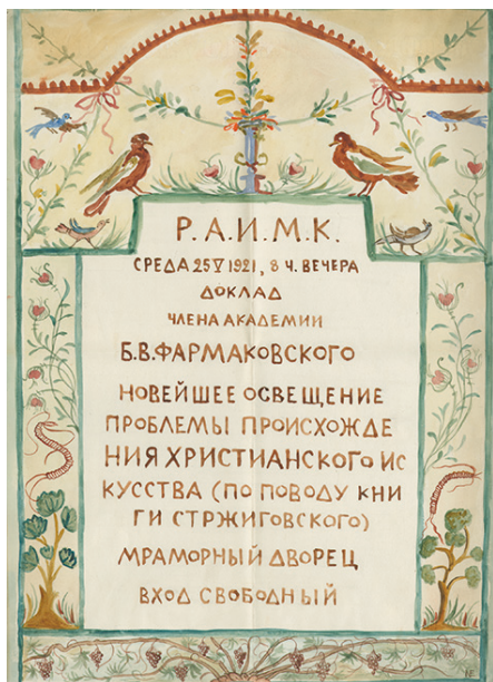
Илл. 53. Н. А. Энман. Афиша к докладу Б. В. Фармаковского «Новейшее освещение проблемы происхождения христианского искусства (по поводу книги Стржиговского)». 1921 г. РО НА ИИМК РАН. Ф. 2. Оп. 1. 1921. Д. 123. Л. 19. Публикуется впервые