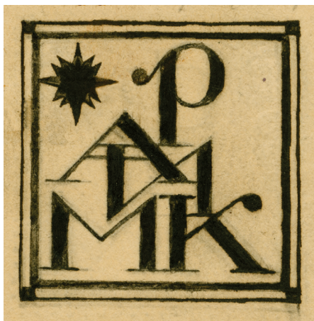
Илл. 55. М. В. Добужинский. Книжный знак Российской Академии истории материальной культуры. 1920 г. РО НА ИИМК РАН. Ф. 2. Оп. 1. 1920. Д. 9. Л. 20