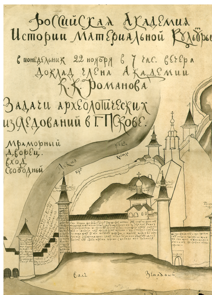
Илл. 50. К. К. Романов. Афиша к докладу «Задачи археологических исследований в г. Пскове». 1920 г. РО НА ИИМК РАН. Ф. 2. Оп. 1. 1920. Д. 72. Л. 9. Публикуется впервые