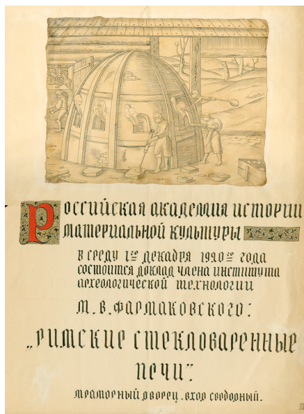
Илл. 52. М. В. Фармаковский. Афиша к докладу «Римские стекловаренные печи». 1920 г. РО НА ИИМК РАН. Ф. 2. Оп. 1. 1920. Д. 72. Л. 12. Публикуется впервые