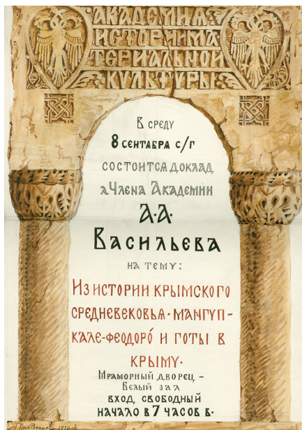
Илл. 57. В. В. Воинов. Афиша к докладу А. А. Васильева «Из истории крымского средневековья. Мангуп-Кале-Феодоро и готы в Крыму». 1920 г. РО НА ИИМК РАН. Ф. 2. Оп. 1. 1920. Д. 73. Л. 20. Публикуется впервые