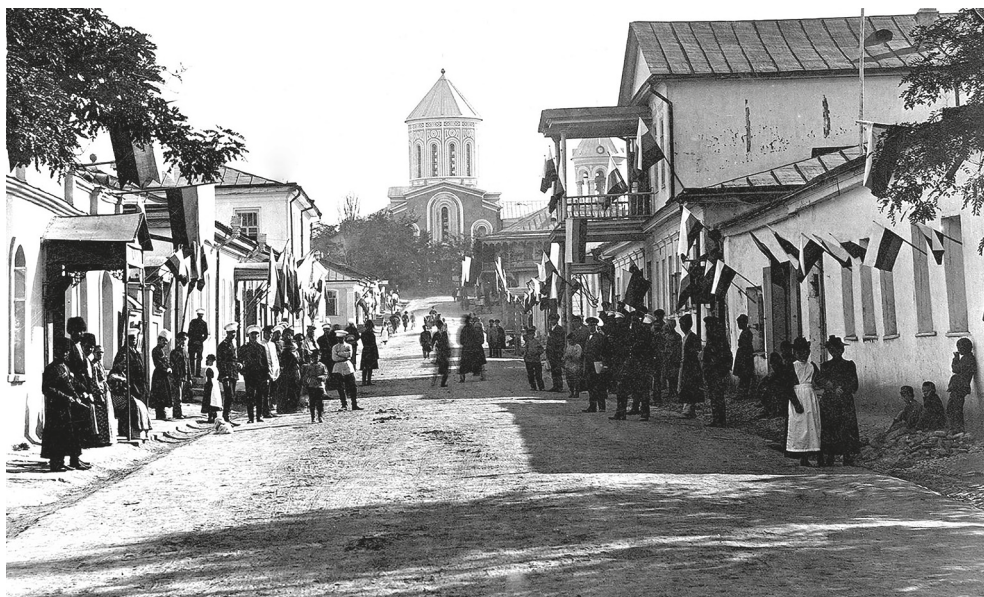
Рис. 1. Собор в Темир-Хан-Шуре, 1854–1860 гг. Вид с севера. Фотография 1910–1917 гг.