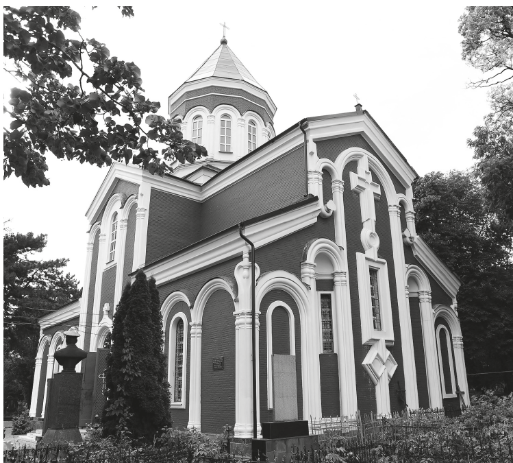
Рис. 4. Армянская церковь Сурб Карапет в Нахичевани-на-Дону, 1875. Фотография А. Ю. Казаряна, 2017