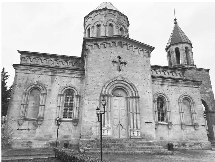
Рис. 3. Армянская церковь в Дербенте, 1868 г. Фотография А. Ю. Казаряна, 2020