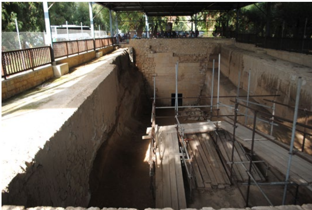
Илл. 1. «Гробница Стасанора» в Курионе. Первая четверть V в. до н. э. Лимассол, Кипр.