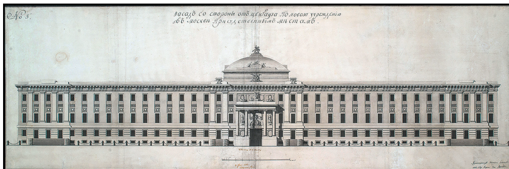
Илл. 34. Здание Сената в Московском Кремле (1776–1787, М. Ф. Казаков, при участии К. И. Бланка). 1-й комплект чертежей (1776). Главный фасад. ГНИМА