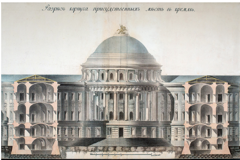
Илл. 37. Здание Сената в Московском Кремле (1776–1787, М. Ф. Казаков, при участии К. И. Бланка). 4-й комплект чертежей (1799–1801). Разрез по двору с фасадом ротонды (фрагмент). ГНИМА