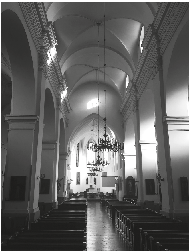
Рис. 1. Церковь св. Гиацинта в Варшаве. 1605–1638. Интерьер. Вид с юго-запада.