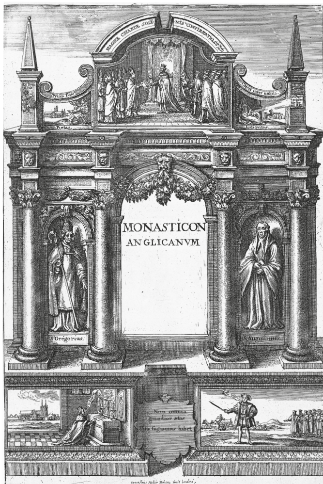
Рис. 1. Венцель Холлар. Титульный лист к изданию: W. Dugdale. Monasticon Anglicanum or The History Of the Ancient Abbies . London, 1655. Vol. 1.

Пейзаж, если и появляется, превращается скорее в некий отвлеченный символ пространства, обрамляющего исторически значимое сооружение или архитектурный комплекс, как это воплощено в листе «Торренсис, аббатство в Девоне: перспективный вид на руины». Рисовальщик и гравер Дэвид Логган издает « Oxonia Illustrata » (лат. «Иллюстрированный Оксфорд», 1675) [12], совмещая топографически точные виды зданий Оксфорда с птичьего полета, выявляющие планировку и размещение основных помещений, изображение фасадов и интерьеров с «костюмными студиями». Д. Логгану принадлежат гравюры сходного по структуре трактата « Cantabrigia Illustrata » (лат. «Иллюстрированный Кембридж», 1690). В начале XVIII столетия с Оксфордом связана ра-