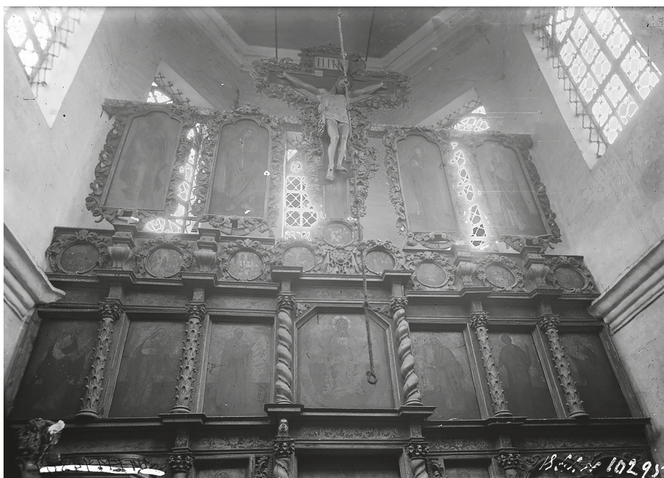
Илл. 107. Иконостас собора Петра митрополита Высокопетровского монастыря. Фото. Съемка ЦГРМ. До 1934 г. Фототека ГНИМА. Колл. 1. № 10295