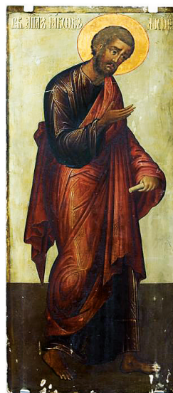
Илл. 106. Царский изограф Тихон Филатьев и другие неизвестные иконописцы Оружейной палаты. Икона: апостол Иаков из иконостаса церкви Рождества Богородицы в Голутвине. Ок. 1690/1691 г. ГТГ, инв. 24447