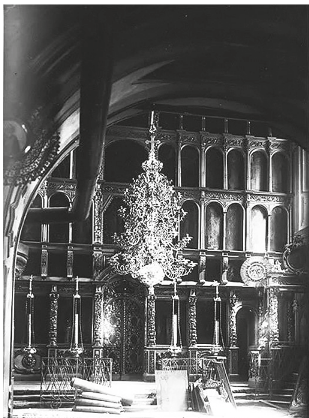
Илл. 103. Иконостас собора Боголюбской иконы Божьей матери Высокопетровского монастыря. Фото 1928 г. Фрагмент