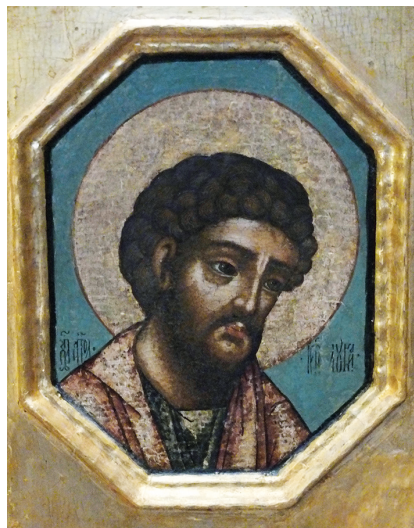
Илл. 111. Икона: апостол и евангелист Лука из царских врат иконостаса церкви Покрова Богородицы Высокопетровского монастыря. До 1690 г. (?). Экспозиция, ГИМ