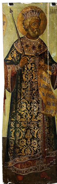
Илл. 105. Царский изограф Тихон Филатьев и другие неизвестные иконописцы Оружейной палаты. Икона: царь Давид из иконостаса церкви Рождества Богородицы в Голутвине. Ок. 1690/1691 г. ГТГ, инв. 24445