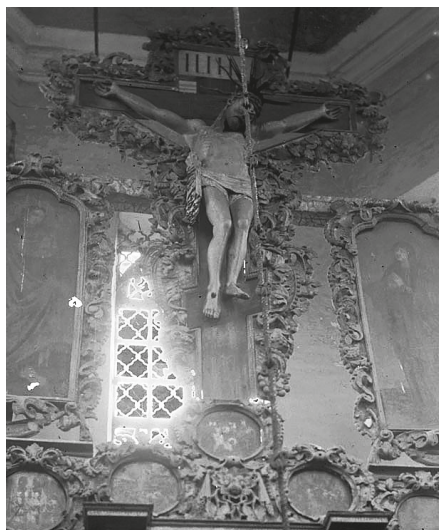
Илл. 108. Иконостас собора Петра митрополита Высокопетровского монастыря. Фото. Съемка ЦГРМ. До 1934 г. Фототека ГНИМА. Колл. 1. № 10295. Фрагмент