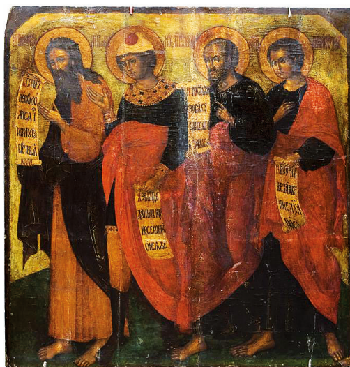
Илл. 109. Иконописец Спиридон Григорьев. Икона: пророки Иеремия, Даниил, Елисей, Аввакум из пророческого чина Преображенской церкви в селе Большие Вяземы. Ок. 1698 г. ГТГ