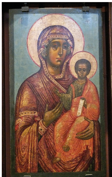
Илл. 112. Икона: Богородица Одигитрия из местного ряда церкви Покрова Богородицы Высокопетровского монастыря. До 1690 г. (?). Экспозиция, ГИМ