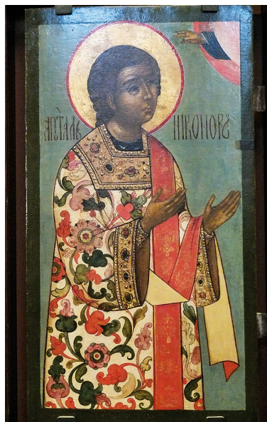
Илл. 113. Икона: апостол Никанор из апостольского чина церкви Покрова Богородицы Высокопетровского монастыря. До 1690 г. (?). Экспозиция, ГИМ