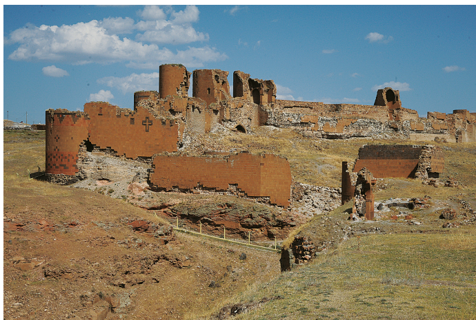
Илл. 39. Ани. Западный участок Смбатовых стен, конца X–XIII вв. Фото А. Ю. Казаряна, 2015