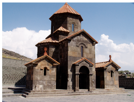
Илл. 42. Церковь монастыря Дзагаванк после реставрации. Фото А. Ю. Казаряна, 2014