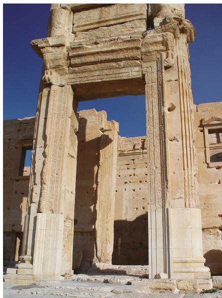
Илл. 44. Пальмира, портал храма Бэла, 32 г. н.э. Фото А. Ю. Казаряна, 2003