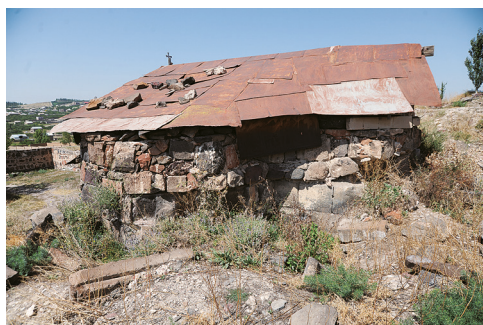
Илл. 41. Церковь VII в. монастыря Дзагаванк до реставрации, Армения. Фото А. Ю. Казаряна, 2009