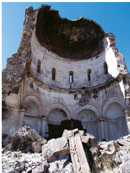
Илл. 45. Ани. Церковь Сурб Пркич (Спасителя), 1035 г. Фото А. Ю. Казаряна, 2007