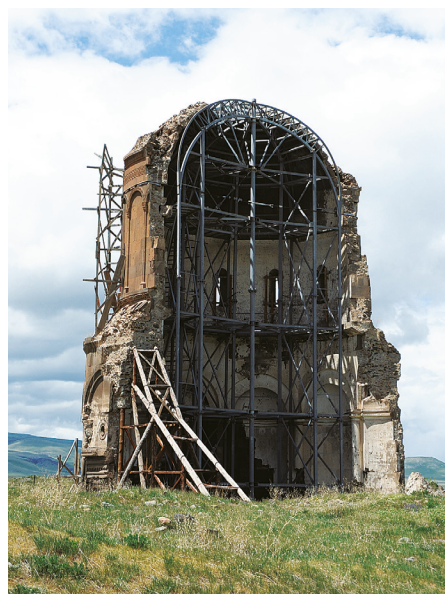
Илл. 46. Ани. Церковь Сурб Пркич (Спасителя) в ходе консервации руины. 2017