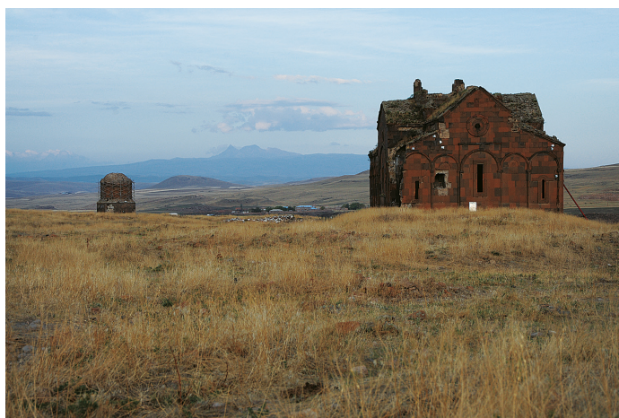
Илл. 40. Ани. 2015