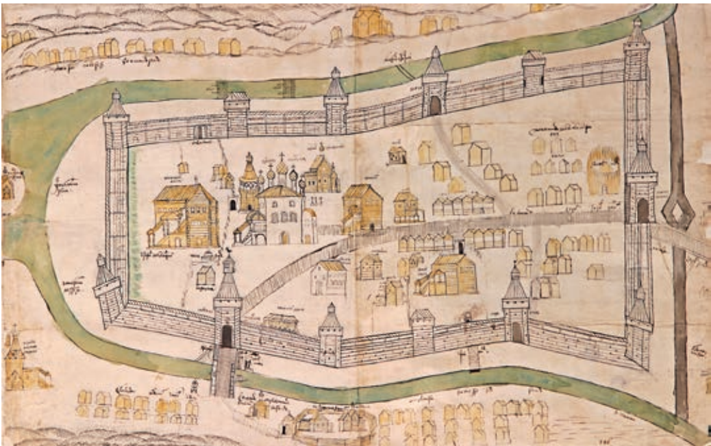
181. План Олонца первой половины 1690-х гг. Санкт-Петербург, БАН ОР