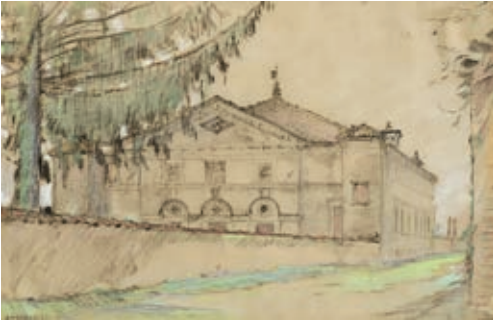
179. Г. К. Лукомский. Синагога XVI в. в Польше. 1922 г.

180. «Азбука фряская» 1604 г. СПбИИ РАН. Ф. 115, № 169, л. 62. Образцы начертаний скорописных букв «а» с цветной орнаментальной «монограммой» «азъ» неовизантийского стиля и орнаментированным «киноварным» инициалом «А», выполненным чернилами. В композицию листа также включены скорописные лигатуры «азъ», размещенные над каждой строкой образцов и организованные по принципу упрощения графики лигатур и изменения их ориентации от горизонтальной к вертикальной