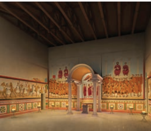
Илл. 9. Храм культа римского императора в Луксоре. Кон. III – нач. IV в. Египет, Луксор. Интерьер. Реконструкция Д. А. Карелина, визуализация Д. А. Карелина, М. А. Карелиной