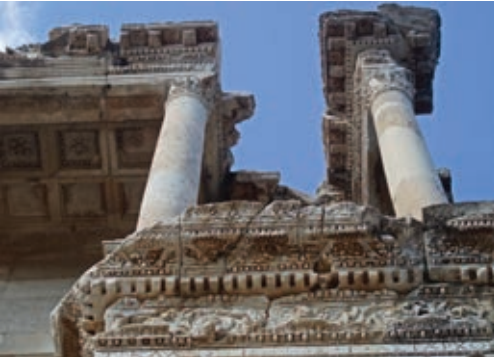
Илл. 5. Библиотека Цельса. Часть антаблемента. 114–135 гг. н. э. Эфес.