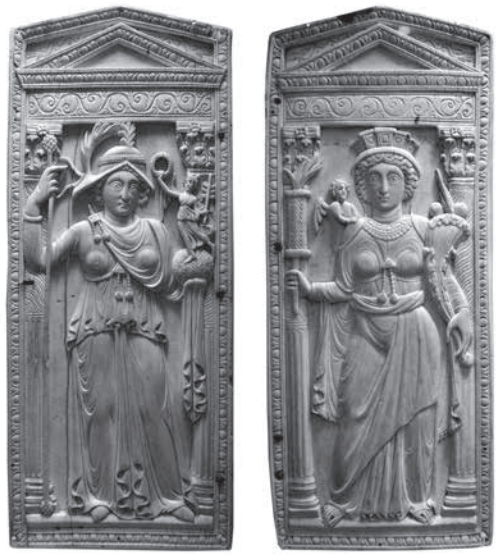
Рис. 5. Персонификации Рима и Константинополя под балдахином. Рельефы слоновой кости. Кон. V – нач. VI в. Музей истории искусств в Вене, Австрия (Inv. No X 37, 38). Фото Д. А. Карелина (2015 г.)