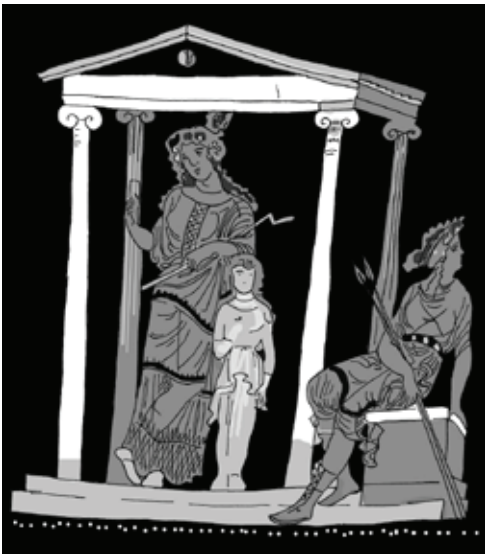
Рис. 3. Мастер Ликурга. Изображение навеса на краснофигурном кратере со сценой из мифа об Ифигении в Тавриде (ГМИИ. Инв. П 16 504). Ок. 350 г. до н. э. Южная Италия, Апулия. Рисунок Е. А. Лопатиной, основывается на: [8, с. 233]