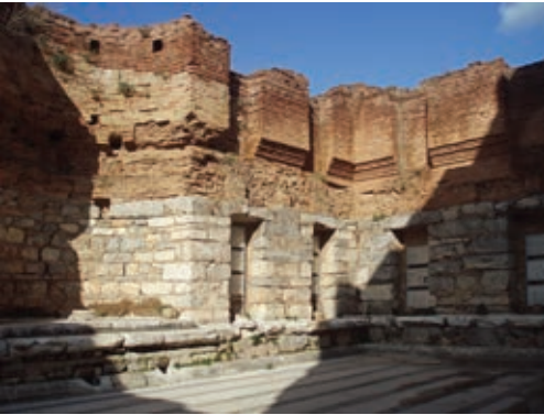
Илл. 7. Библиотека Цельса. Читальный зал. 114–135 гг. н. э. Эфес.