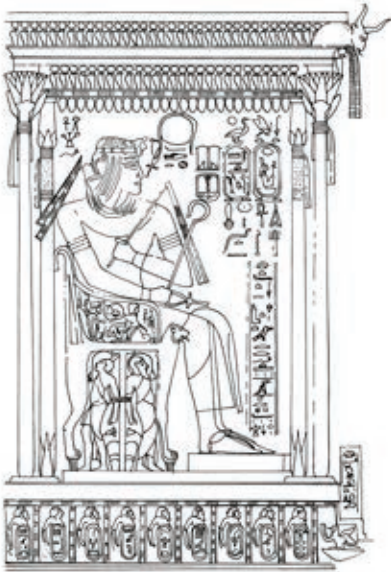
Рис. 2. Аменхотеп III под балдахином. Изображение из гробницы Хаемхета (ТТ 57). XVIII династия, XIV в. до н. э. Египет, Шейх Абд эль-Курна. Рисунок Е. А. Лопатиной, основывается на: [57, Taf. 189]