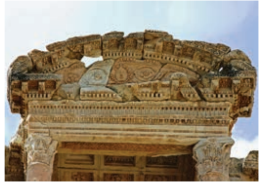
Илл. 6. Часть центрального фронтона библиотеки Цельса в Эфесе. 114–135 гг. н. э. https://commons.wikimedia.org/wiki/Category:Decoration_of_the_Celsus_library_in_Ephesus