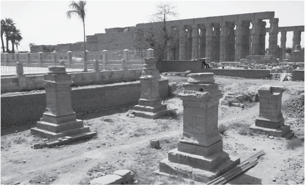
Рис. 1. Римская крепость в Луксоре. Руины восточного тетрастиля. 308–309 гг. Египет, Луксор. Фото Д. А. Карелина (2007 г.)

В то же время в истории архитектуры было принято считать, что, не желая иметь ничего общего с языческими храмами, христиане избрали в качестве прототипа для церквей базилику, так как этот тип зданий имел минимальное религиозное значение в римском язычестве [55; 35, р. 41]. Однако в последнее время данная точка зрения все больше подвергается сомнению, так как известны и примеры языческих базиликальных храмов.