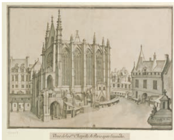
Илл. 132. Этьен Мартелланж. Сент-Шапель в Париже. 1630 г. Национальная библиотека Франции, Париж