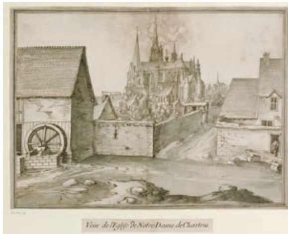
Илл. 130. Этьен Мартелланж. Вид на церковь Богоматери в Шартре. 1624 г. Национальная библиотека Франции, Париж