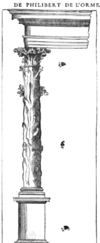
Рис. 1. Филибер Делорм. Колонна. Гравюра из трактата «Первый том архитектуры». 1568. Национальная библиотека Франции, Париж

В «Первом томе архитектуры» (1568 г.) Ф. Делорм одну из глав посвящает виртуозно разработанным и декоративно решенным перекрытиям типичных для XVI в. позднеготических построек [5, р. 107]. Выделяя веерные и сетчатые своды, теоретик архитектуры предлагает свою концепцию математических расчетов и художественного оформления перекрытий храмов. Порывая с устоявшейся ордерной системой, автор вводит не только тип муфтированной колонны, но и колонну в виде дерева с капителью-кроной (Рис. 1). Назидательное повествование о пути архитектора к славе и признанию Ф. Делорм сопровождает двумя аллегорическими изображениями. Сталкивая целеустремленность и апатию, похвалу и клевету, знание и необразованность, автор трактата представляет исполненные скрытого смысла фигуры в окружении ландшафта и построек, символический смысл которых создает определенную ауру происходящего.