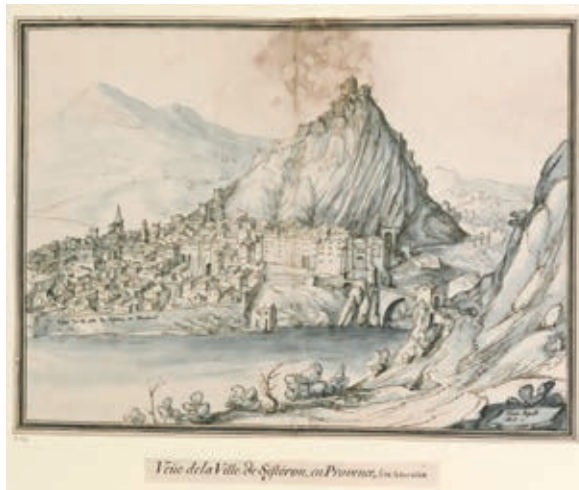
Илл. 131. Этьен Мартелланж. Вид на Систерон в Провансе 31 августа 1608 года. 1608 г. Национальная библиотека Франции, Париж