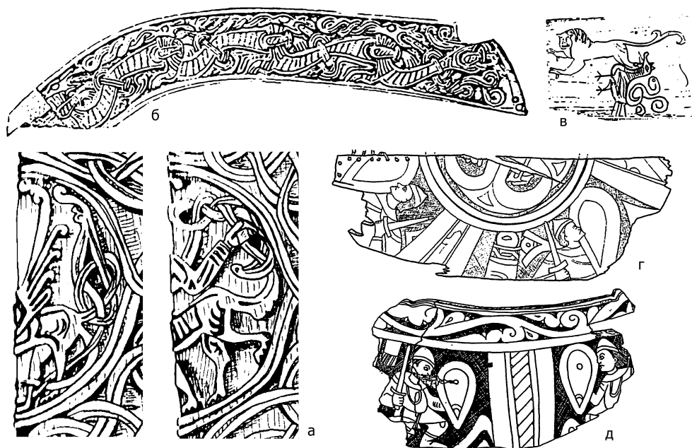
Рис. 1. Изображения Группы I: а) резная колонна с изображениями грифона и кентавра в медальонах, 1040–1080 гг.; б) орнаментированный брус с изображением драконов, середина XI в.; в) гусли с изображением льва и птицы, первая половина XII в. Изображения Группы III: г) крышка блюда (?) с изображением воинов, первая половина XIII в.; д) скобка (?) с изображением воинов, 1210–1240-е гг.

крова на Нерли, где по двум сторонам от царя Давида (кстати, держащего в руках псалтирь — гусли) расположены композиции из оскаленных львов и птиц [4, с. 161]. Однако церковь Покрова на Нерли датируется 1165 г., а изделия из серебра с чернью получили распространение со второй половины XII в. [13, с. 85], в то время как новгородские гусли датируются первой половиной века. Таким образом, это небольшое маргинальное изображение свидетельствует о том, что общий для всего Средневековья изобразительный прием украшения тел животных ростками был известен на Руси еще до появления владими́ро-суздальских храмов и широкого распространения серебряных украшений.