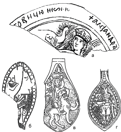
Рис. 3. Изображения Группы IV: а) дно чаши с изображением человека и птицы, конец XIII в.; б) лопасть ложки со сценой единоборства со зверем, вторая четверть XIV в.; в) ложка со сценой единоборства со львом, первые десятилетия XIV в.; г) ложка с изображением воина, первые десятилетия XIV в.

С интервалом в полвека на разных раскопах Новгорода были найдены два предмета с практически идентичным декором — предположительно крышка блюда и скобка [20]. На наружных стенках изделий изображены воины с мечами и щитами. Мы знаем два близких аналога этих изделий — это чаши, найденные при раскопках древнерусских